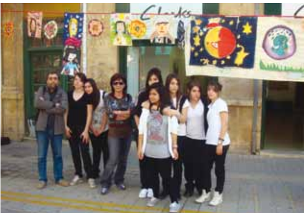
Οι μικροί ζωγράφοι καινοτόμησαν και πάλι! Οι μαθητές-καλλιτέχνες του σχολείου μας τη μέρα δημιουργικότητας και καινοτομίας παίρνοντας ένα πινέλο, ξεδίπλωσαν το ταλέντο τους ζωγραφίζοντας πάνω σε πανό.