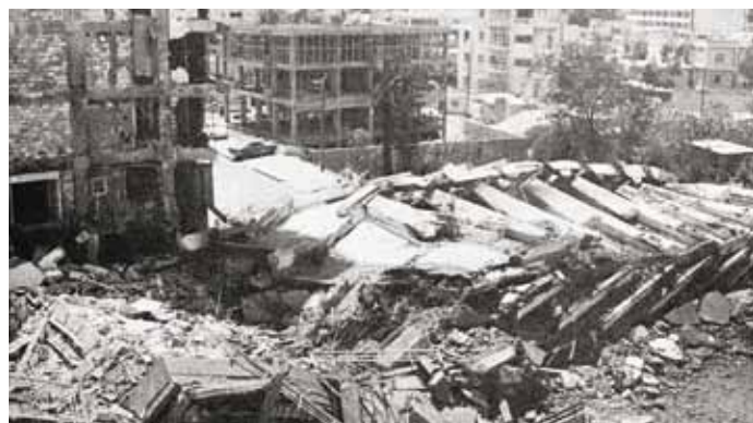
Οι τελευταίες εικόνες από την Αμμόχωστο και τα συναισθήματα του πατέρα μου Μιχάλη Πρωτοπαπά.