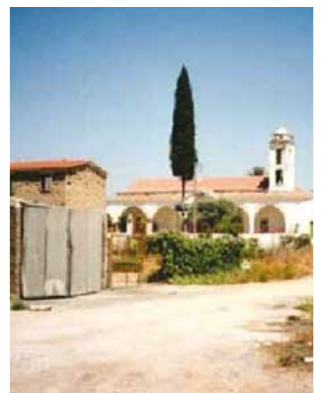
Φωτογραφία από το χωριό Λευκόνοικο.