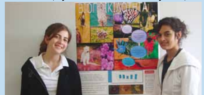
Το σχολείο μας έλαβε μέρος στο διαγωνισμό για τη δημιουργία αφίσσας με θέμα τη βιοποικιλότητα. Για του λόγου το αληθές, ιδού το έργο μας.