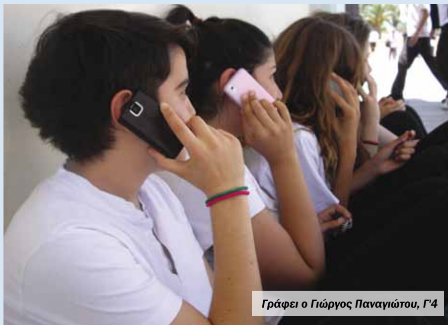
Γράφει ο Γιώργος Παναγιώτου, Γ4

Μέχρι που μια μέρα είδα στην Αμερική έναν άνθρωπο να γυρνά στους δρόμους μιας μεγαλούπολης κρατώντας κάτι ύψους 25 εκατοστών και βάρους σχεδόν ενός κιλού να σταματά κάπου και να πατά κάτι κουμπιά πάνω στη συσκευή, βγάζοντας ένα ήχο για κάθε πάτημα κάπως σαν μπιπ μπιπ. (Τότε νόμισαν ότι ήταν βόμβα και τον άφησαν να κάνει με την ησυχία του το τηλεφώνημά του.) Έπαιρνε τηλέφωνο τον άσπονδο