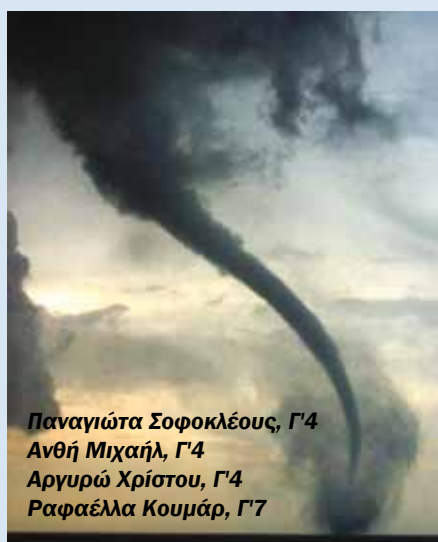
Παναγιώτα Σοφοκλέους, Γ4 Ανθή Μιχαήλ, Γ4 Αργυρώ Χρίστου, Γ4 Ραφαέλλα Κουμάρ, Γ7

να αυξηθούν και τα σχετιζόμενα με το κλίμα κρούσματα ασθενειών. Επίσης ενδέχεται να έχουμε εξάπλωση σοβαρών λοιμωδών νόσων που μεταδίδονται μέσω φορέων. Η εξάπλωση νέων ή μεταναστευτικών επιβλαβών οργανισμών θα απειλήσει τη ζωή ζώων και φυτών.